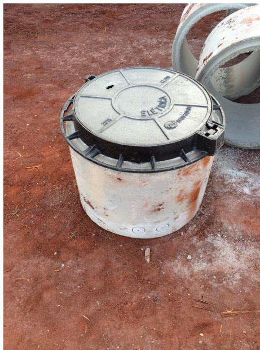
Detalhes das caixas de passagens